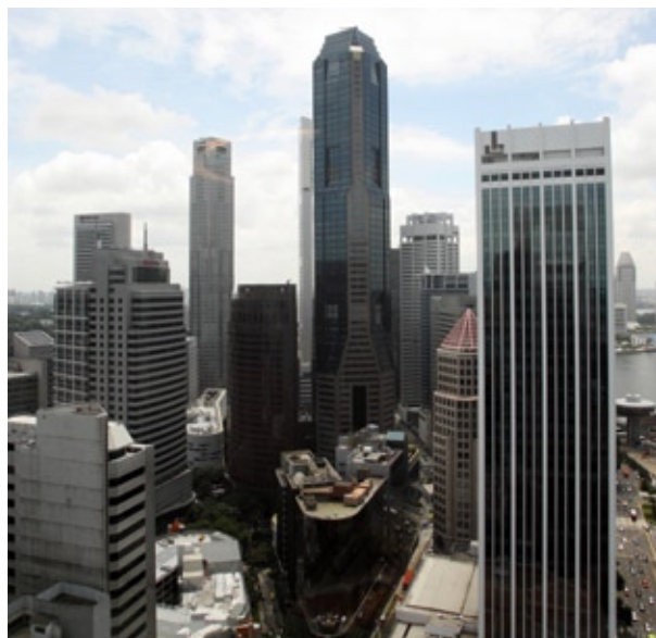
新加坡是2008年全球第四大商业枢纽，同时也在2008年全球竞争力排名中世界第二，仅次于美国。

根据国际万事达卡所发表的2008年全球商业枢纽指数，新加坡挤下香港，一跃成为全球第四大商业枢纽，排名在伦敦、纽约和东京之后。