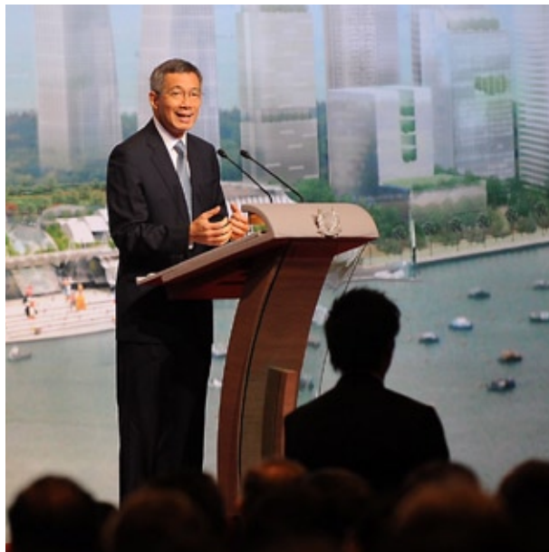
新加坡总理李显龙为首届新加坡水资源周主持开幕仪式。

新加坡也于同一期间举行世界城市峰会及东亚宜居城市峰会。这三大盛会共吸引了来自世界各国的8500名部长、市长、高级政府官员、专家学者、私人企业和非政府组织代表齐聚新加坡。