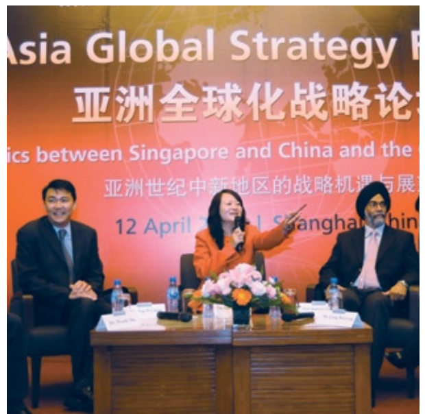
由“联系新加坡”、国大管理学院和华东校友会在上海联合主办的《亚洲全球化战略论坛》，吸引了200多名曾在新加坡工作、学习及生活的优秀人才出席。

论坛突出亚洲企业在国际化的过程中所面对的机遇和挑战，通过介绍亚洲主要经济体尤其是中国和新加坡之间微妙的战略伙伴关系，让企业知道如何借