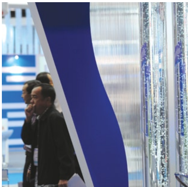
水博览会约4000平方米的展览场地设有中国、德国、荷兰、日本、以色列及新加坡的展馆，重点展出这些国家的水科技。

研发中心将从日本总公司及在美国的分公司输入专业知识及新薄膜技术，并在与新加坡国立大学、南洋理工大学及用事业局和属下的先进水科技中心合作，希望能开发出全方位的薄膜应用技术方案。中心也将与新加坡的水务企业合作，把新加坡国内外的经验和专业知识输入新加坡和输出到国外。