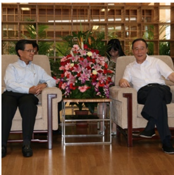
新加坡副总理黄根成(左)和中国副总理王岐山(右)共同主持中新双边合作联委会。

目前，生态城内的4平方公里起步区的土地准备工作、道路修建及服务中心都已完成、总体规划纲要也大致确立。两国将结合经验之长，通过成立委员会、“软件交流办公室”或二合一等合作方式，针对生态城内的公共住房、居民生活方式、教育、培训及招商引资等领域进行研究，鼓励与协助居民形成环境友好的行为习惯。与此同时，也将有更多新加坡政府机构参与天津生态城项目，凸显了新加坡政府对该项目的重视程度。 ■