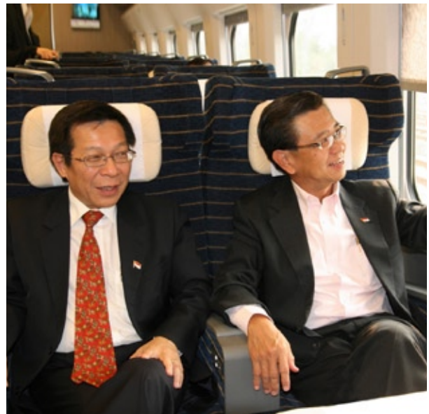
新加坡国家发展部部长马宝山(左)与副总理黄根成(右)一同搭乘新开通的北京——天津城际高速铁路列车前往北京。

新中自贸协定是在亚细安—中国自贸协定的框架下进行，但所涵盖的范围更深更广。除了经贸合作外，两国人员往来、海关程序、卫生及植物检疫等也在协定条款中。随着协定的落实，两国商人势必都能从中获益，实现双赢。