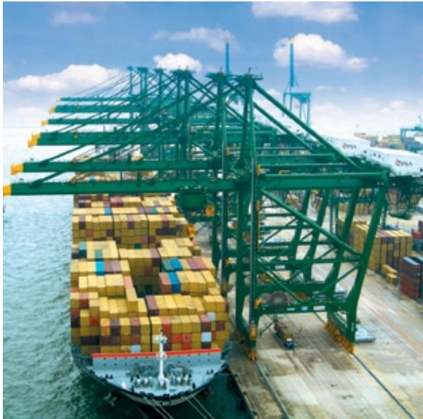
上海振华港口机械集团投资200万美元，在新加坡成立东南亚第一个分公司及备件中心。

全球最大、市占率达70%的集装箱码头岸桥制造商——上海振华港口机械集团投资200万美元（273万新元），在新加坡成立东南亚第一个分公司及备件中心，为新加坡港务集团、裕廊码头、各船厂等公司提供服务，也进一步拓展集团在东南亚的业务。