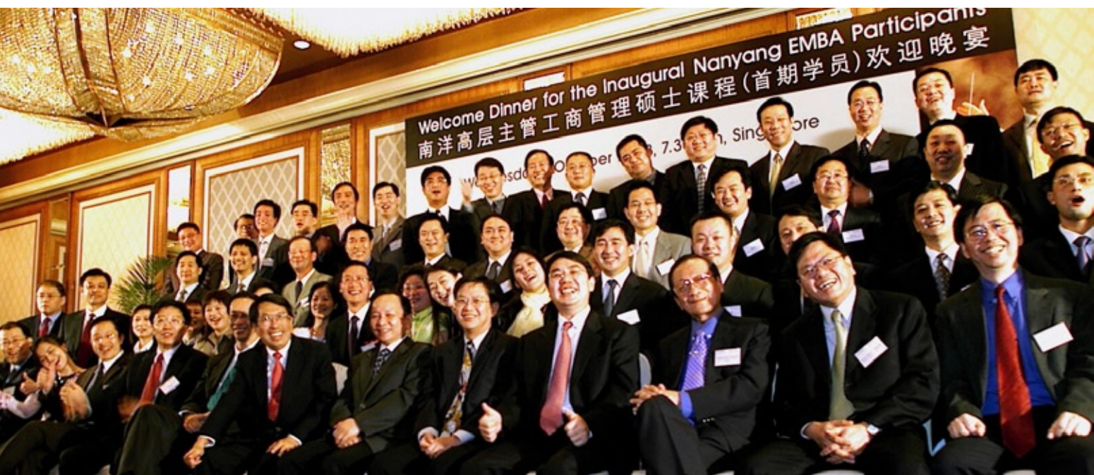
南大与上海交通大学联办的EMBA在2006年被评为中国市场最具领导力EMBA合作项目第二名，在2007年排名第一。

新加坡吸引许多中国企业家、经理和高级公务员前来进修。他们回国后，形成了一个强大的人脉网络，为中国的经济和公共行政做出重大贡献。